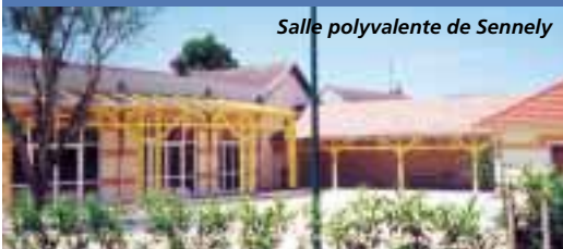
Salle polyvalente de Sennely

Les communes d'Ardon, de Sennely et de Neuvy en Sullias ont entrepris des travaux d'aménagement de leurs salles grâce à cette aide.