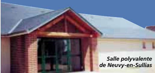
Salle polyvalente de Neuvy-en-Sullias

Visant une dynamique économique intercommunale équilibrée et des sites d'accueil adaptés aux besoins des entreprises, le Contrat de Pays soutient la création de zones d'activités intercommunales. Dans ce cadre, la Communauté de Communes du Val d'Ardox a obtenu 185 000 F pour l'acquisition et la remise en état du futur site de la zone d'activité intercommunale.