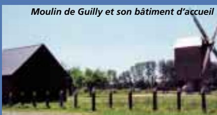
Moulin de Guilly et son bâtiment d'accueil