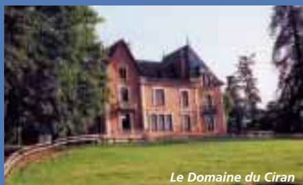
Le Domaine du Ciran

Le Pays soutient également des projets collectifs d'acquisition de matériel agricole. En ont bénéficié : la CUMA de Sully (175 000 F), la CUMA La Solognote (32 000 F), la CUMA d'Isdes (175 000 F), La CUMA des Muids (102 000 F).