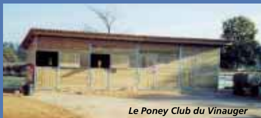
Le Poney Club du Vinauger

Ainsi, le poney club du Vinauger à La Ferté Saint Aubin et le Rudiobus de Vienne en Val ont perçu des aides pour acquérir des équipements équestres.