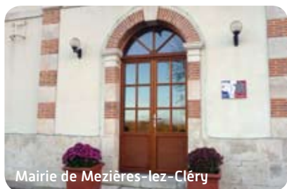
Mairie de Mézières-lez-Cléry